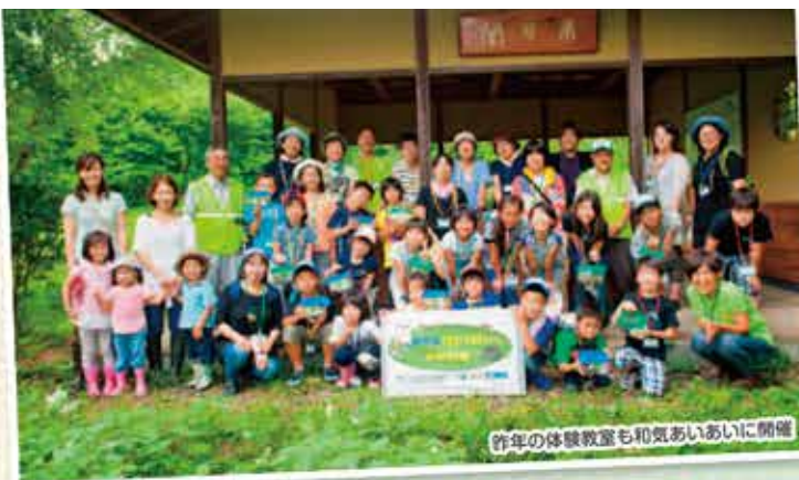
昨年の体験教室も和気あいあい開催