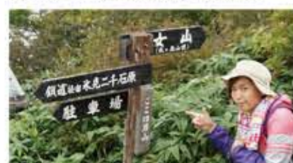
山頂前でも一歩一歩高さはのびのびと。

駐車場で車を置いて、まずは瓶ヶ森までのハイキングからスタート。登山口から瓶ヶ森山頂までの標高差は約200m。登山初心者でもゆっくり登れば、余裕で登れる。氷見二石原の笹原を眺め休憩を挟みつつ、約50分で瓶ヶ森(男山)に到着。編集部☆子もまだまだ余裕の表情。