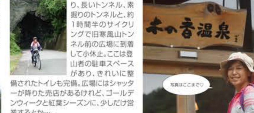
ツアーの締めは道の駅に併設の木の香温泉にゆっくり浸かって、疲れをほくそう。