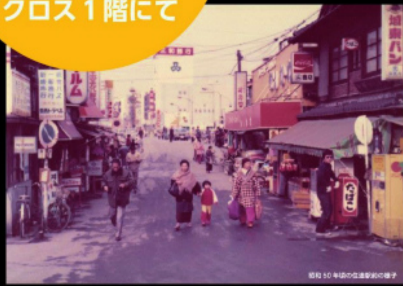
昭和50年代の生活風景の様子