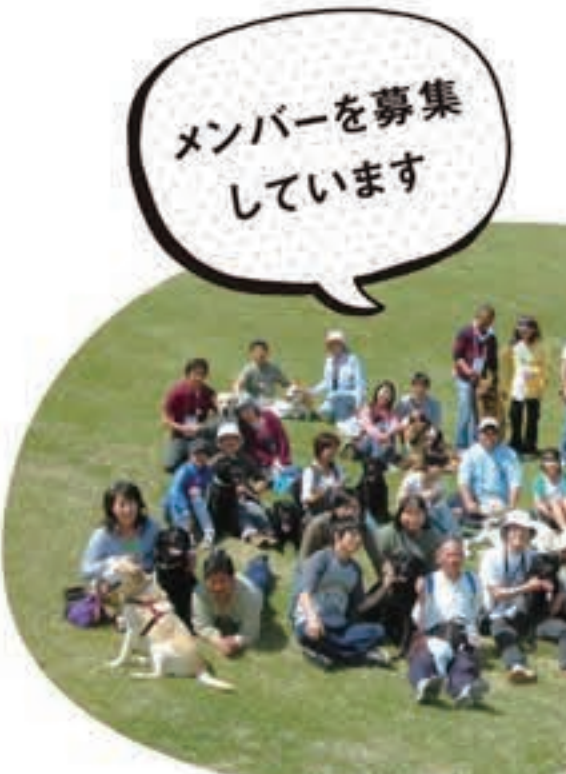
メンバーを募集しています

りでも、犬は理解していないことがほとんど。主従関係をしっかりと築き、「私が主人である」ということを飼い犬に示せば、多くの飼育トラブルは解決できるのです」