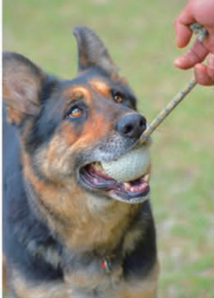
ジャーマン・シェパードは持来欲が強く、警察犬に向いています

飼い主から犬を預かってしつけをする「預託訓練」は、生後数カ月の幼犬から入所可能。犬種によって異なるものの、訓練期間は最低3カ月です。訓練は入所日から始まりません。まずは訓練所の環境と犬を訓練士に慣れさせるための期間を設けます。そこで用いられるのが、獲物を捕らえて自分の住処に持ち帰る「持来欲」を生かした訓練。「遠くに投げた枝やボールを取りに行かせ、戻ってきたらきちんと褒める。そんなアクションを繰