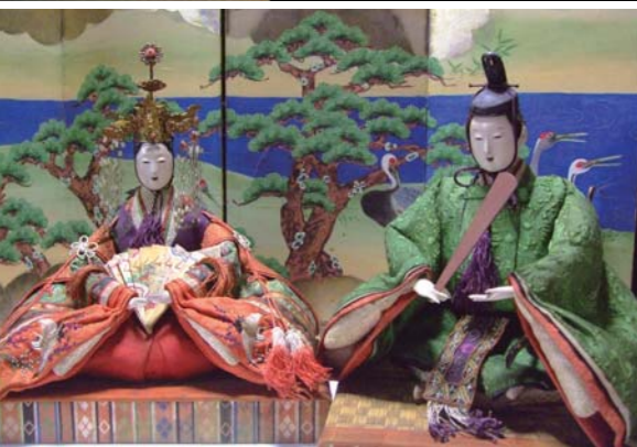
〈春の特別展 雛まつり〜江戸の雛・京阪の雛〜〉2014年2月1日(土)〜4月15日(火) 全国でも秀逸の収蔵を誇る同館人気の企画展。江戸時代後期から明治時代にかけての雛人形と雛道具の名品を紹介。今回は、江戸と京阪の雛人形の違いをテーマにした趣向で展示。

日本玩具博物館 所在地/姫路市香寺町中仁野671-3 (JR香島駅から徒歩約15分) 電話/079-232-4388 営業時間/10:00~17:00 休館日/水曜(祝日及び春休み、夏休み中は開館)、年末年始 入館料/一般 500円、高校・大学生 400円、 子ども(4歳以上)200円 http://www.japan-toy-museum.org