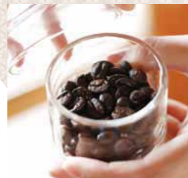
それぞれに個性があるコーヒー豆。10種類以上もある中からお気に入りを見つけてみては?