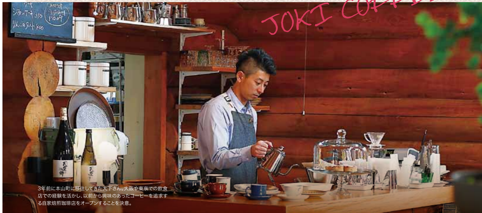
3年前に本山町に移住してきた天下さん。大阪や東京での飲食店での経験を活かし、以前から興味があったコーヒーを追求する自家焙煎咖啡店をオープンすることを決意。