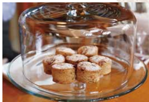
オリジナルの「スコーン」(200円)。自家製の天然酵母やテンサイ糖、ビーカンナッツを使用。