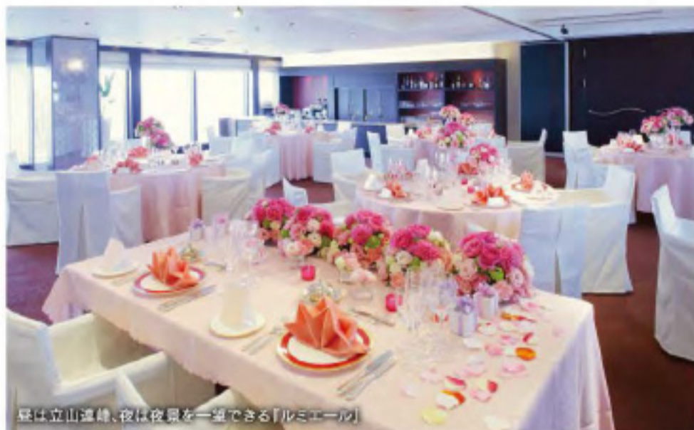
昼は立山連峰、夜は夜景を一望できる「ルミエール」