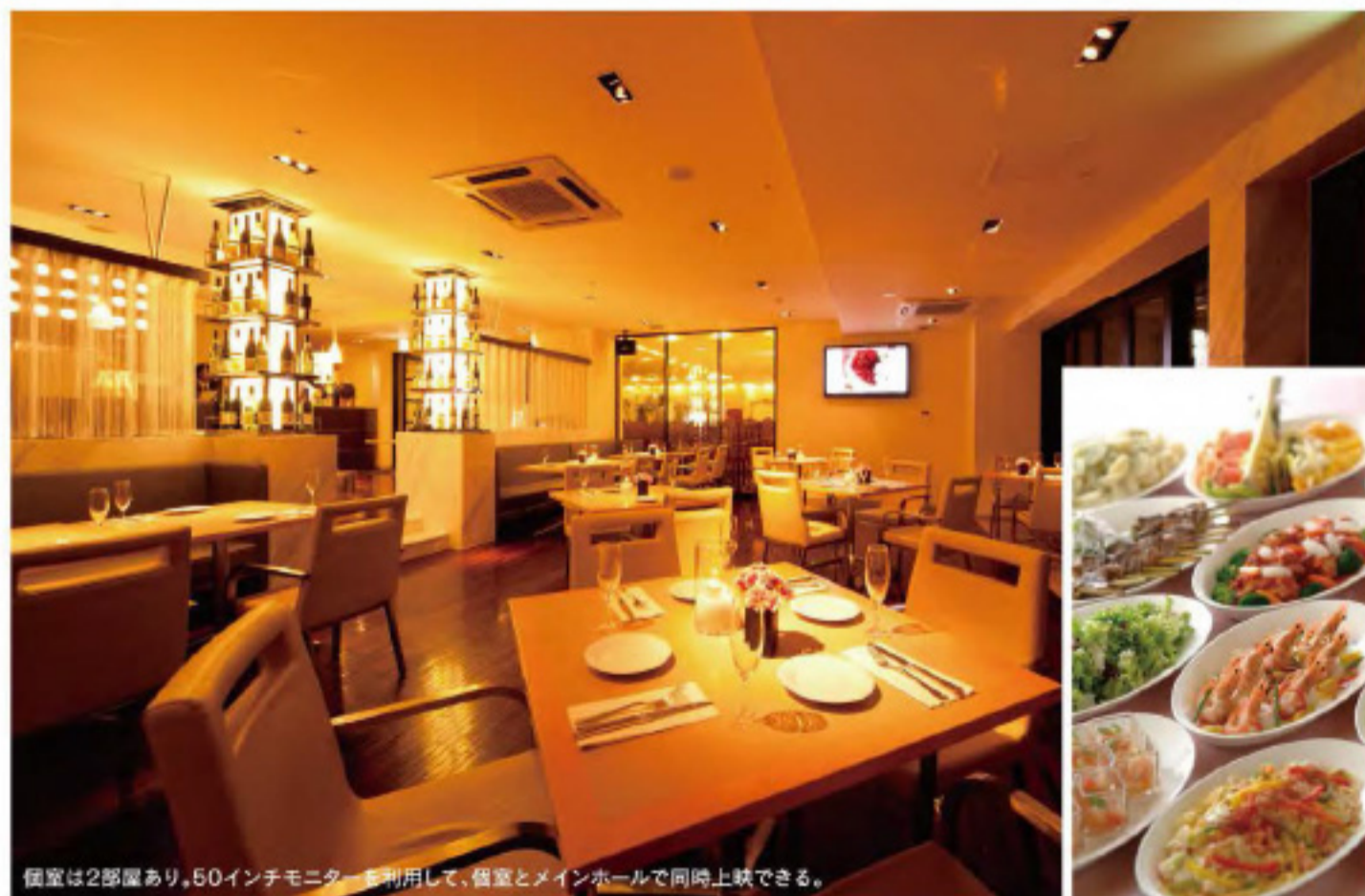
個室は2部屋あり、50インチモニターを利用して、個室とメインホールで同時上映できる。