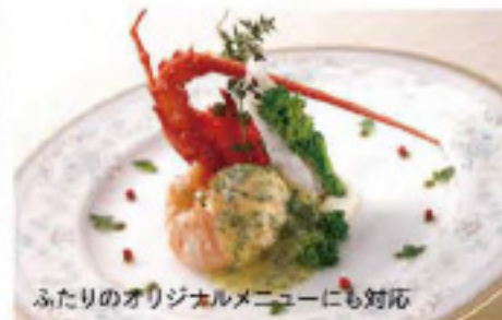
ふたりのオリジナルメニューにも対応