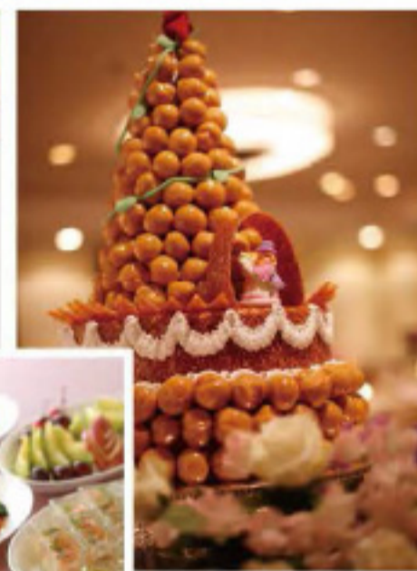
人気の「シュ・シュ・クリームタワー(¥15,000~)」。