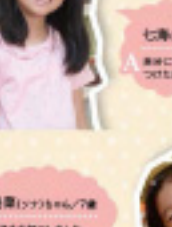
七海(ななみ)ちゃん/名 A 七海(ななみ)ちゃん/名