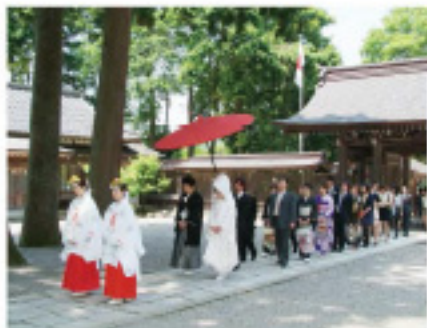
1100円から神仏婚式プラン(神式、祝儀、高砂、高札)40348,000円