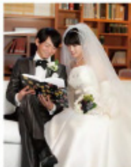
豪華ロケーションプラン4167,800円(平日限定)