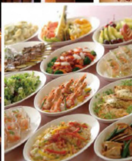
季節の食材を生かした料理は、予算に合わせてオーダーメイドも可能。