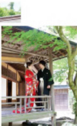
豪華ロケーションプラン4168,000円(平日限定)