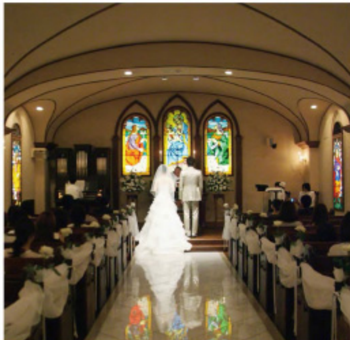
【Wed】オリジナルコンパクトウェディング形式8名様専用プラン4358,000円