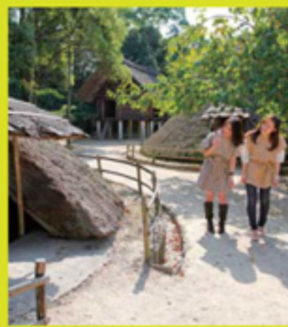
穀物倉庫として使われていた「高床倉庫」は小動物の侵入を防ぐ「ねずみ返し」など、暮らしの知恵を感じられる造り。建物の中からポーズを決めて、バシャリと記念撮影もOK!

【体験メニュー】 まが玉づくり/500円(約60分) 土器・埴輪づくり/700円(約60分) 開催日/土曜日・日曜日・祝日(予約不要) 開催時間/9:00~17:00(受付は15:00まで) ※体験メニューは他にもあります。詳しくは博物館までお問い合わせください。 ※10名以上の団体様の場合は、事前予約が必要になります。