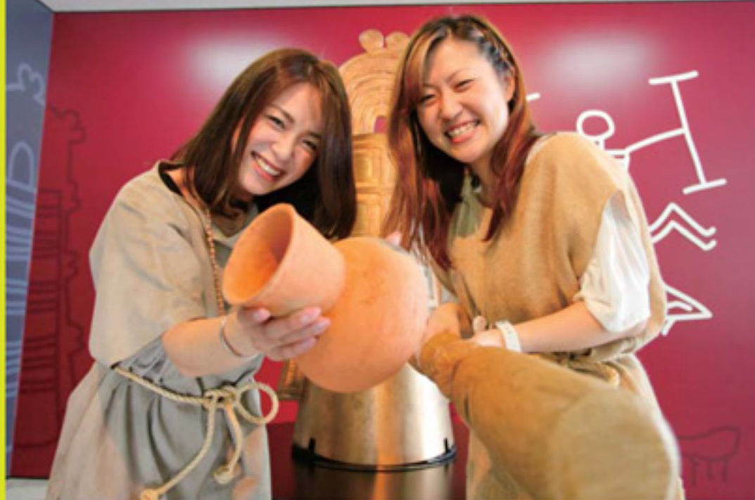
博物館では、弥生時代の衣服の無料貸し出しもあり。入口のレプリカ銅鐸の前で、記念撮影なんていかが？

「銅鐸」とは、今から約2000年前、弥生時代の頃につくられた釣鐘型の青銅器。これまで全国で約500個が発見されているものの、その確かな用途は今も解明されておらず、古代史のミステリーとして研究者たちの探究心をくすぐり続けている。ロマンあふれる遺物なのだ。野洲市ではこれまで24個の銅鐸が発見されており、同博物館にてそれらを展示、あわせて発見の経緯や当時の歴史などを学ぶことができる。