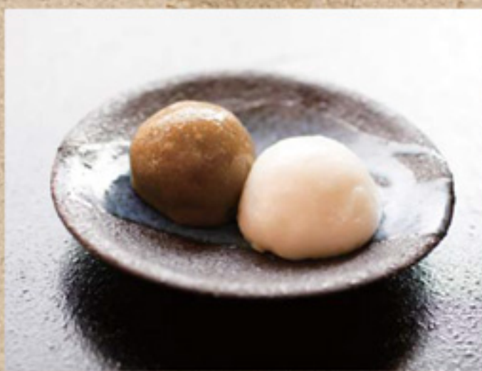
たでもち / 630円(5ヶ) 緑(左)のものは生地なたでの粉を、そして白のものは、中の餡にたでを加えた人気メニュー。地元野洲産の米粉を使いながら、伝統の技術でもっちり感を再現したその技はお見事!