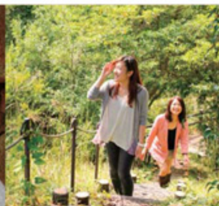
遊歩道歩いていると様々な草花。紅葉が色づくこの季節は、地元の人々だけではなく中山道と合わせて散策を楽しむ観光客にも人気が高い。