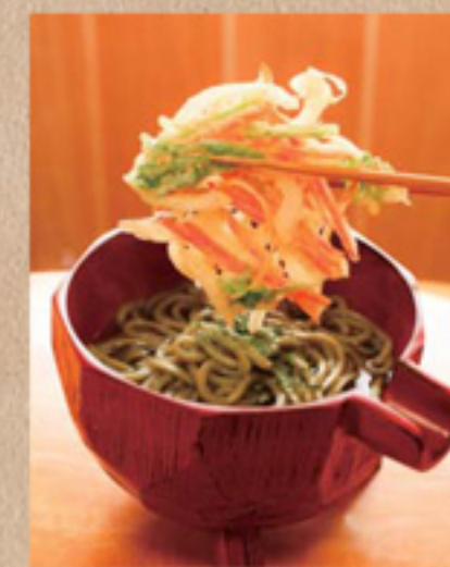
たでうどん / 600円(単品) 野洲在住の女性5人で作る「笑CO嬢CLUB」が開発したこのメニューは、ますたで入りの麺の風味と食感を楽しんで、それからたぶりの野菜のかき揚げをダシに浸せば、さらに旨!

☎077-586-0010 野洲市小篠原2114-1 営業時間 / 10:00~18:00 定休日 / 日曜日・祝日・月曜不定休 駐車場 / 近くの「日本パーキング」をご利用下さい。90分まで当店負担