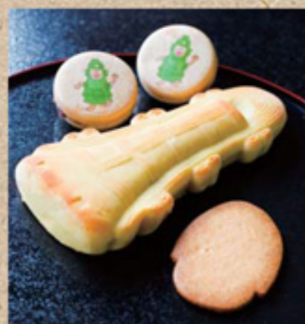
(奥)ドウタクくんもなか (中)どうたく焼き / 1890円 / 892円(5ヶ) (手前)どうたくサブレ / 80円 どうたく焼きは30年ほど前の人気商品を復刻!実はゆるキャラブームの先駆けでもあるご当地マスコット「ドウタクくん」のもなかとサブレは、観光地のお土産にも大人気!