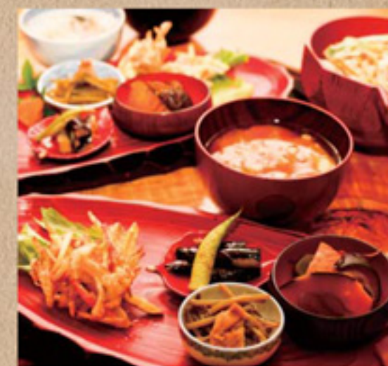
旬のお野菜ランチ / 1000円 長野県立科の由緒ある味噌を使った具だくさんの味噌汁はたっぷりボリューム和え物、揚げ物、煮物、酢の物の4種の旬野菜小鉢も味わい深く、食後は心地いい満足感に包まれる。