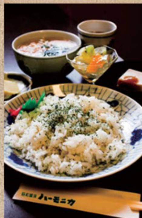
みたらし団子セット / 300円 外はごんがり、そして中はもっちりとした食感のみたらし団子とほうじ茶のセット。お団子には品質のいい近江米をたっぷり。プラス50円で、深い甘みの黒蜜きなこセットに変更OK! たですしセットA / 750円 すし飯にたでの粉と、ちりめんじゃこを混ぜた「たですし」は酸味と苦みが大人テイスト!これにまたにゅう麺に合う18セットは、全ての飲み物が200円引きに、特に自然焙煎のコーヒーはオススメ!

手づくり舎 ふあ〜もあ もっちり食感のたでうどんて体の芯からほっかほか! 野菜を中心にした、どこまでも体に優しい献立のランチが定評のある同店のオススメは、なんと!いつも野洲の新鮮な「たでうどん」。麺に練り込んだたでの粉は、ほんのりとした辛みが心地よく、箸を進めるうちに体もほっこり。木曜日限定の手づくり焼きたてパンも人気で、ランチついでに買い求めるお客も多数。お悩みに効果的な野菜やその調理法などもスタッフにぜひ尋ねてみて。「たでうどん」は野洲駅北口側の寿司屋「脂雅」でも味わえます。