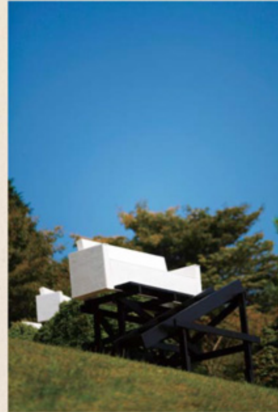
六甲山カンツリーハウス ガーデン・スカイ / Hidemi Nishida 見晴らしのいい丘陵に設置されたソファに腰かければ、清々しい秋の空がどこまでも膨大になる。この作品は公募大賞で栄えあるグランプリを獲得!