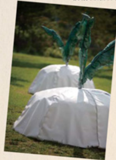
六甲山カンツリーハウス おおきなかぶ ひとやすみ / 萩原由美乃 ロシアの民話「おおきなかぶ」に着想を得たこの作品。のどかなオブジェのそばで、のんびりとお昼寝する人々の姿も。