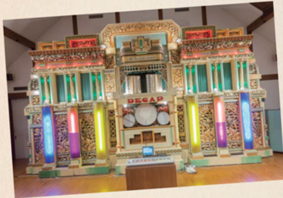
六甲オルゴールミュージアム DECAP EVOLUTION / 明和電機 巨大な自動演奏オルガンが異次元の進化(実演時間は10:20~、12:15~、14:15~、16:15~)