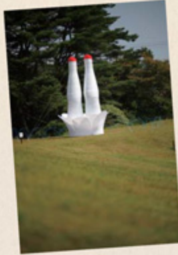
六甲山カンツリーハウス 風のいたづら / 北川純 巨大な乙女が大地にスドンとさかさまに!六甲の風がイタズラにスカートを探らめかせ~!