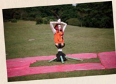
六甲山カンツリーハウス 無題 / 飯沼英樹 作家自身が遊ぶ「美」を、木彫りのモダンな女性の家で再現。ボーリングがなまめかし!

今年で4回目を数える「六甲ミーツ・アート 芸術散歩」では、六甲山の広大な9つの会場に、54作品をズラリとお披露目!見た目のインパクトに思わず歓声をあげてしまう展示から、参加者が実際に体験できる遊び感覚の作品、そして出展するアーティストとの触れ合いを楽しめるものなど、ジャンルは実にさまざま!六甲の夜景を活かした展示もあるので、爽やかな昼間だけではなく、ムードのあるナイトタイムの鑑賞も超オススメ!