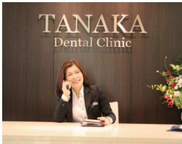
▲理解と納得をしてから治療に入りましょう。その為にも、十分ご相談下さい。