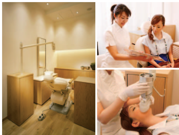
▲(左)完全個室の空間で、歯科とは思えない内装。リラックスして施術を受けられます。/ (右上)30分と充実の無料カウンセリング。歯ぐきの状態や虫歯の有無も確認してもらえます。/ (右下)専用のライティングマシンで光を照射し、ホワイトニングジェルを活性化。

「ホワイトエッセンス」のホワイトニング施術実績は約23万8000件。銀座、新宿でも話題の審美歯科サロンです。豊富な実績を生かし、一人ひとりの歯質に合わせて最も効果が出やすいホワイトニングを実施してきます。全国91医院ならではのスケールメリットを生かしたリーズナブルな値段設定なので、気軽に通えるのも魅力です。カウンセリングは無料で、歯の状態をチェックしてもらった上で、方法や効果についてアドバイスをしてもらえるのも安心ですね。加齢や遺伝により黄ばんだ歯の色素を薬剤と光によって分解し、日本人の歯質に合わせた痛みを抑えた処方を行うてくれるので、自然な白さに仕上がります。1回の施術でも平均で2~3段階のトーンアップを目指して頂けるので、1度でも効果を実感できます。今や芸能人、モデルだけでなく、身だしなみの1つとしてヘアサロン感覚で通う方も多いホワイトニングだからって、専門クリニックをかりつけにしてみてもいい？