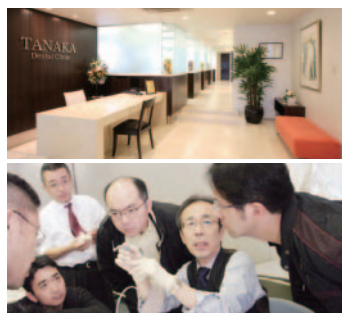
▲講義/講演活動/臨床指導/出張手術等を幅広く行い、後進の育成にも積極的に取り組んでいます。