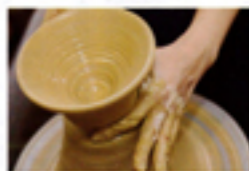
最初はちょっと緊張