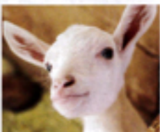
秋は動物の赤ちゃんがたくさん産まれる季節。キュートな顔にパロパロ