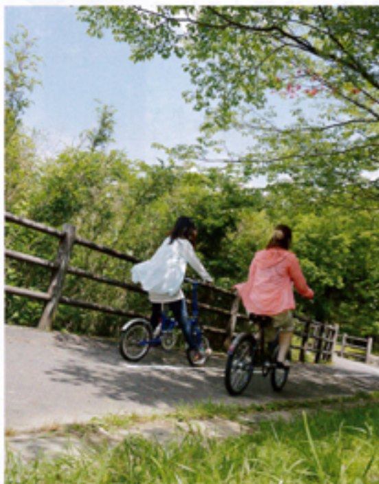
緑の中、自転車と風と駆け抜けるのも気持ちいい。「さが21世紀市民の森」ではレンタルサイクルも