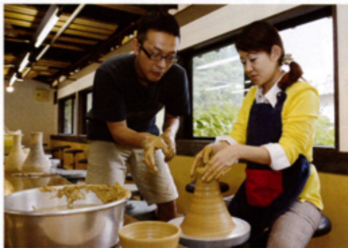
初めての陶芸でも先生が付き添って教えてくれるから安心