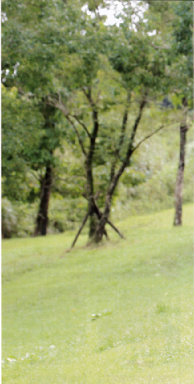
「動物と触れ合うと子どもたちの表情がいっぱいほほえて、ママもにっこり」