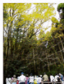
10月初旬から木々が色づきはじめ、10月末が紅葉の見頃