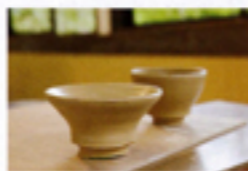
陶芸体験から2週間〜1ヵ月ほどでお届け、到着した器を鑑ると、この旅のことを思い出しそう