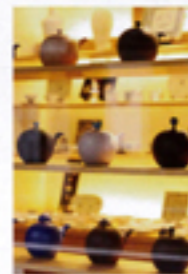
陶磁器で有名な有田の街並みはレトロな建物が多く、かわいい「器屋さん」のぞきながら散歩するのもいい!