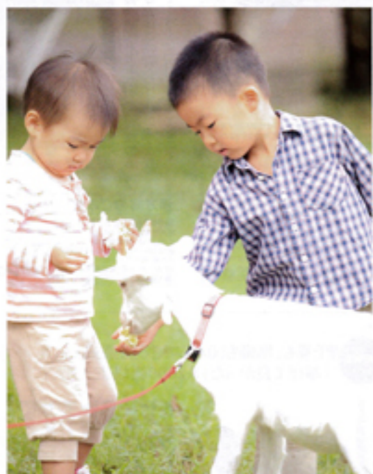
赤ちゃんやぎと戯れる子どもたち。最初は恐る恐るでも、すぐに仲良しです